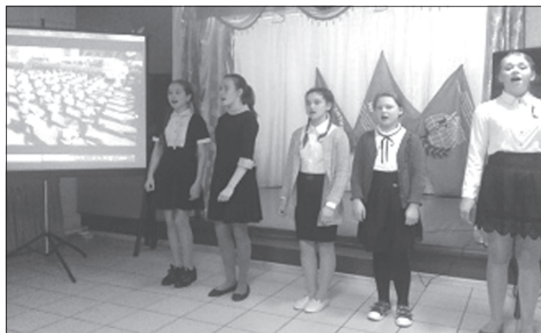
Поём о мужестве, о доблести, о славе.

Память погибших воинов почтили возложением цветов у обелиска и минутой молчания.