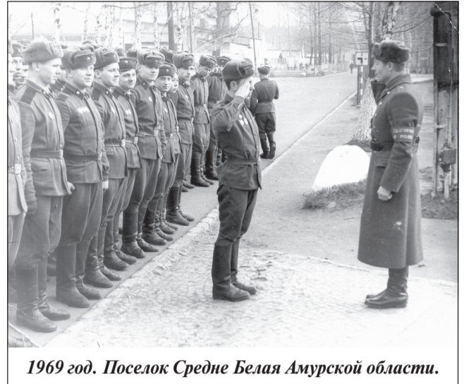
1969 год. Поселок Средне Белая Амурской области.

По характеру Роберт был спокойным человеком, от-