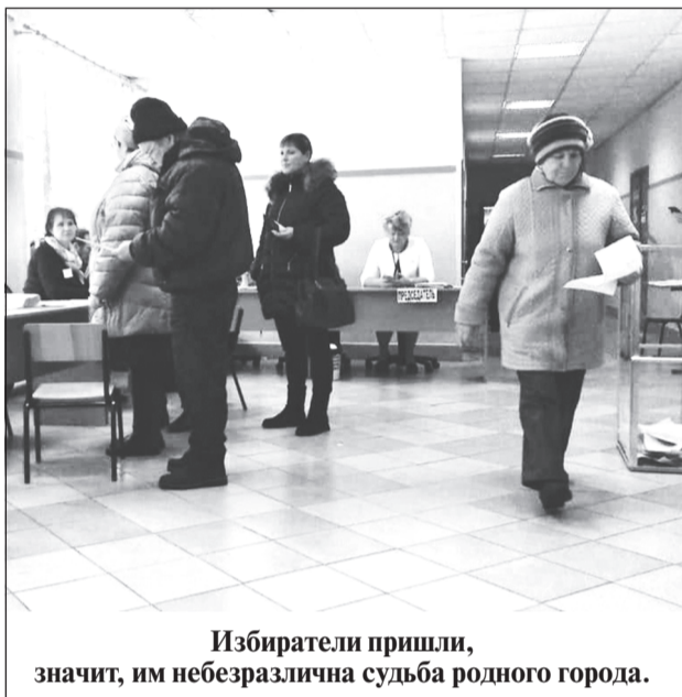
Избиратели пришли, значит, им небезразлична судьба родного города.

В минувший выходной в Плесе состоялись дополнительные выборы депутатов Плесского городского поселения по многомандатному избирательному округу №2.