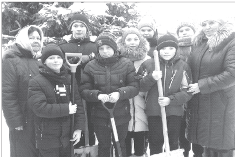
Ребята охотно откликаются на просьбы ветеранов о помощи.

Также был проведен урок мужества «Холокост – память поколений», где ребята познакомились с историей создания концлагерей, о содержании там людей, зверствах фашистов. Шестиклассники подготовили небольшие сообщения о концентрационных лагерях. Целью этого урока было осознание важности сохранения памяти о жертвах Холокоста, об их освободителях. Воспитание у обучающихся негативного отношения к любым формам насилия над человеком является очень важным в наше время.