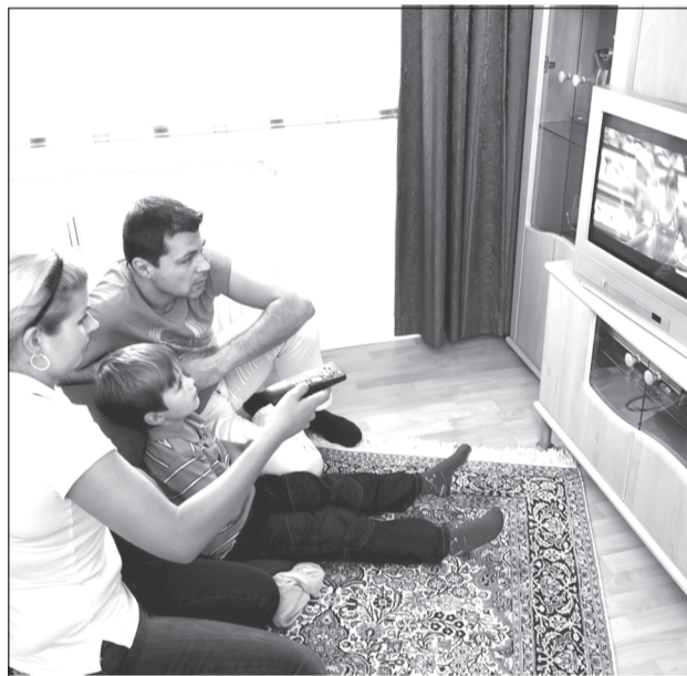
Качество телевизионных программ значительно улучшится.

Наличие буквы А, добавленной к логотипам аналоговых версий телеканалов «Первый канал», НТВ, 5 канал, Рен-ТВ, а вскоре и «Россия-1» и СТС, будет означать, что зритель смотрит старый аналоговый телевизор или новый, но не переключённый в режим приёма цифрового сигнала.