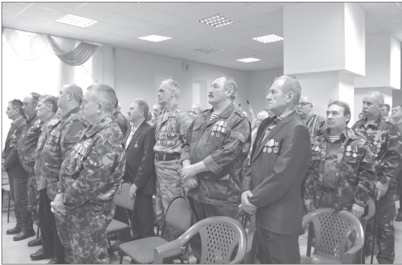
«ЛЫЖНЯ РОССИИ - 2019»

Ждем наших постоянных подписчиков, а также новых, всех, кто хочет быть в курсе районных новостей.